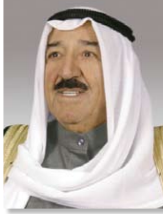
حضرة صاحب السمو الشيخ فهد بن عبد الرحمن آل فوزان أمير دولة الكويت