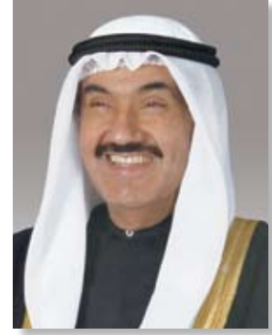
شعور الشيخ فهد بن عبد الرحمن آل فوزان رئيس مجلس الوزراء - دولة الكويت