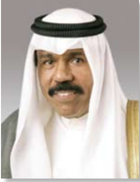
شعور الشيخ فواز بن عبد الرحمن آل فوزان وفي عهد دولة الكويت